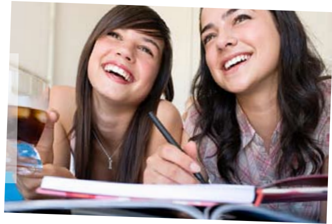
Meine beste Freundin und ich - da gibt's immer was zu lachen