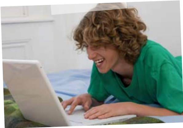
Bitte lächeln - Du bist im Chat...