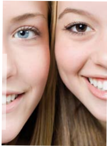
Ein toller Tag!